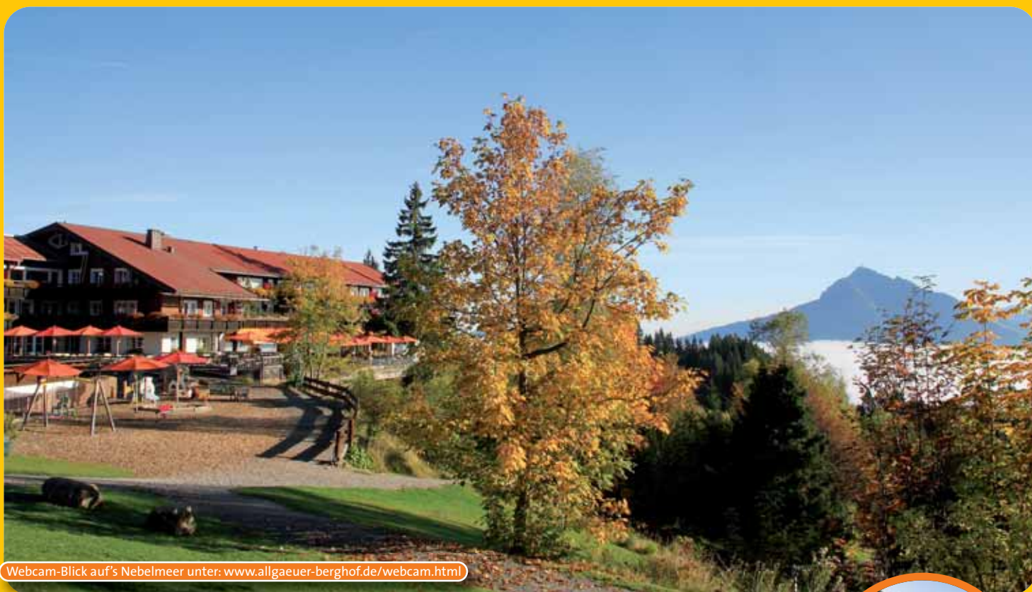
Webcam-Blick auf's Nebelmeer unter: www.allgaeuer-berghof.de/webcam.html